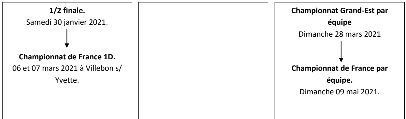
Schéma de qualification :

Pour les niveaux supérieurs, se référer au calendrier de la Ligue Grand-Est Judo (LGEJ).