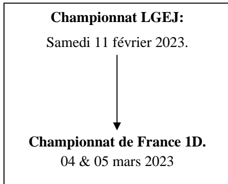
Schéma de qualification :

Rappel : Tout judoka se présentant doit être en règle ou sera refusé. Il doit posséder un passeport avec 2 timbres de licences dont celui de l'année en cours, un certificat médical de moins de 1 an ( validé par le club : licence fédérale informatique à jour) et être minimum ceinture verte .